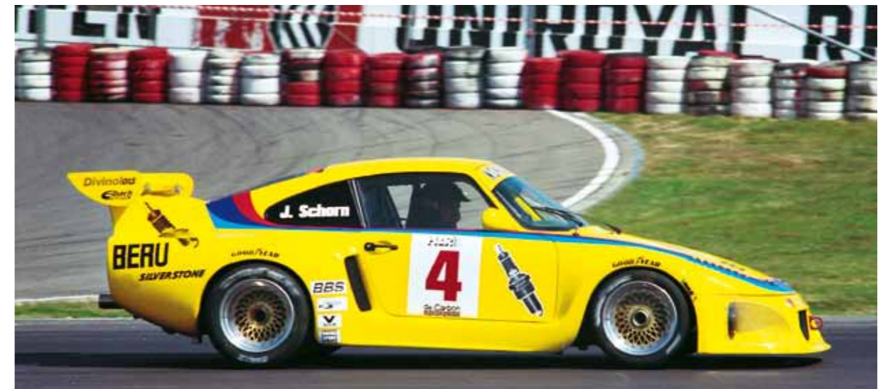
20. August 1989: einmaliger Auftritt im Rahmen der Sportwagen-Weltmeisterschaft auf dem Nürburgring