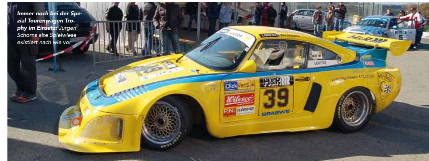
Immer noch bei der Spezial Tourenwagen Trophy im Einsatz: Jürgen Schorns alte Spielwiese existiert nach wie vor

Jürgen Schorn damit seinen ersten Sieg – beim "9. Int. Preis der Stadt Esslingen" auf dem Hockenheimring, dem Finale der Spezial Tourenwagen Trophy 1987.