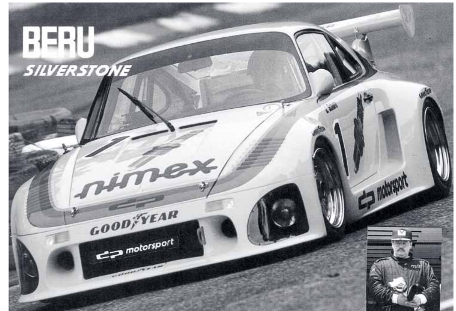
Erinnerung an den 14. Oktober 1988: Eine Autogrammkarte dokumentiert die Premiere des dritten dp-935 II