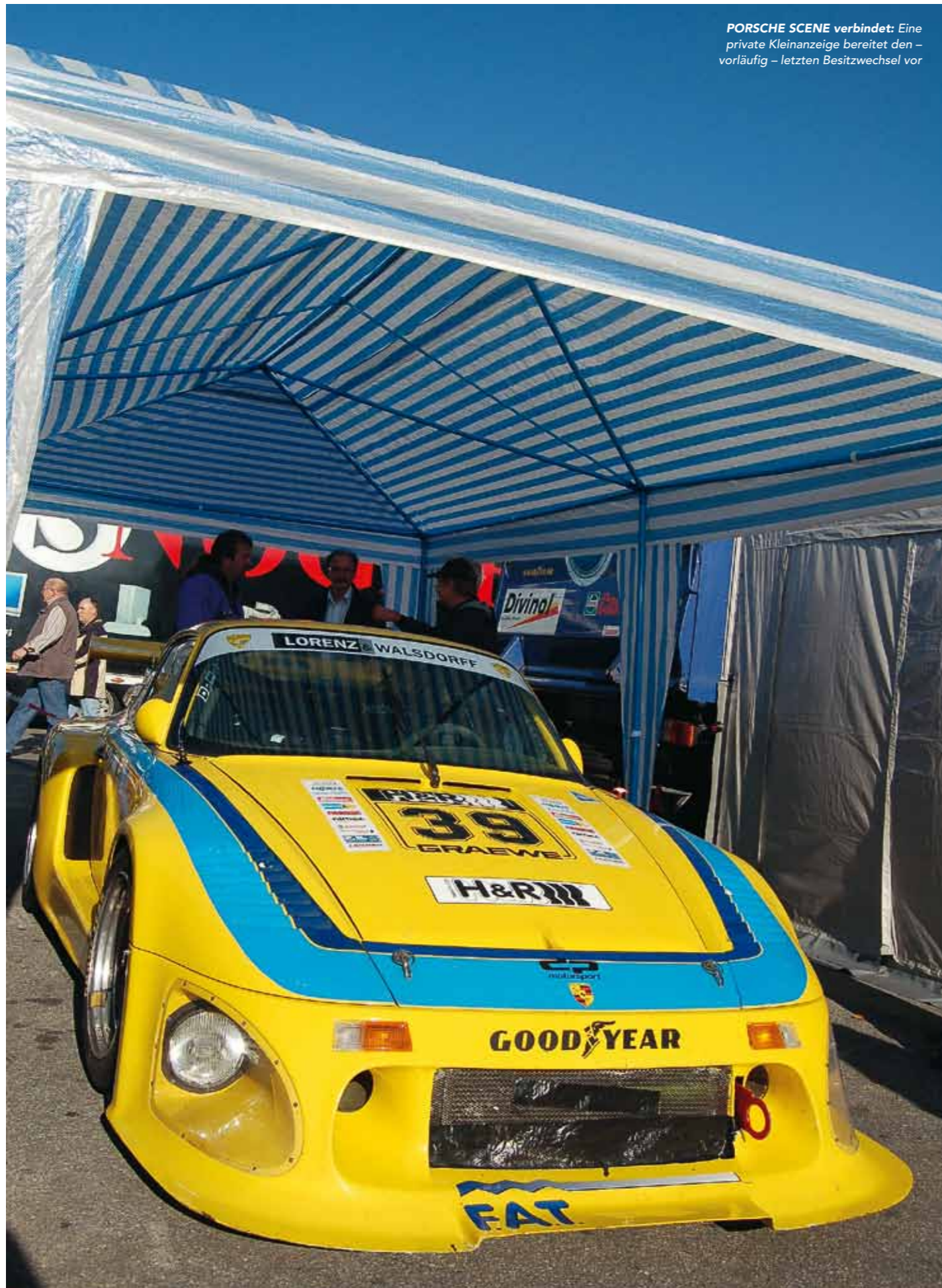
PORSCHE SCENE verbindet: Eine private Kleinanzeige bereitet den – vorläufig – letzten Besitzwechsel vor