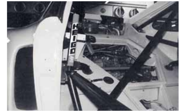
Frühjahr 1989: Der reinrassige Gruppe-C-Rennmotor erfordert einen Hilfsrahmen zur Chassisverstärkung