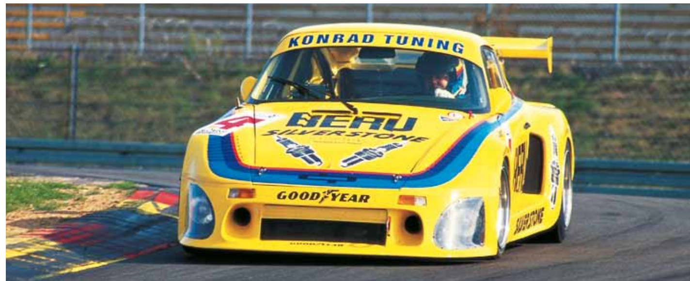
Griff nach den Sternen: Der 2,65 Liter große 956-Gruppe-C-Motor erweist sich als schwieriger Patient