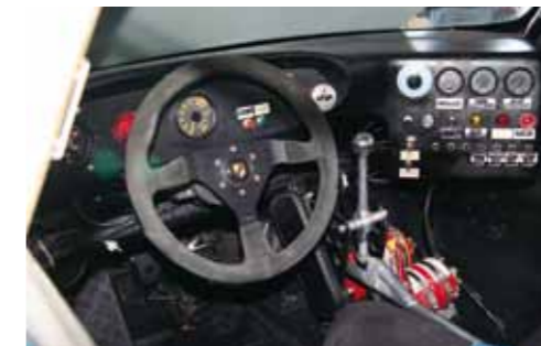
Kommandostand des 1988 an Jürgen Oppermann verkauften Doppelladers: heute in den USA zu besichtigen