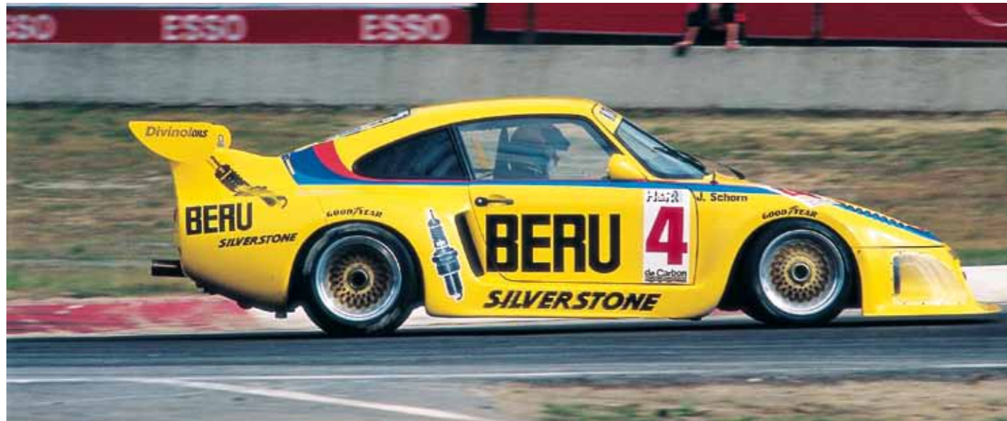
Werbeträger: auf Messen, Katalogen und in Annoncen für Marken wie Beru (Foto), H&R oder Nimex präsent