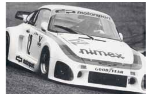
September 1987, Spezial Tourenwagen Trophy, Zolder: Divisionsdritter im ersten kompletten Jahr