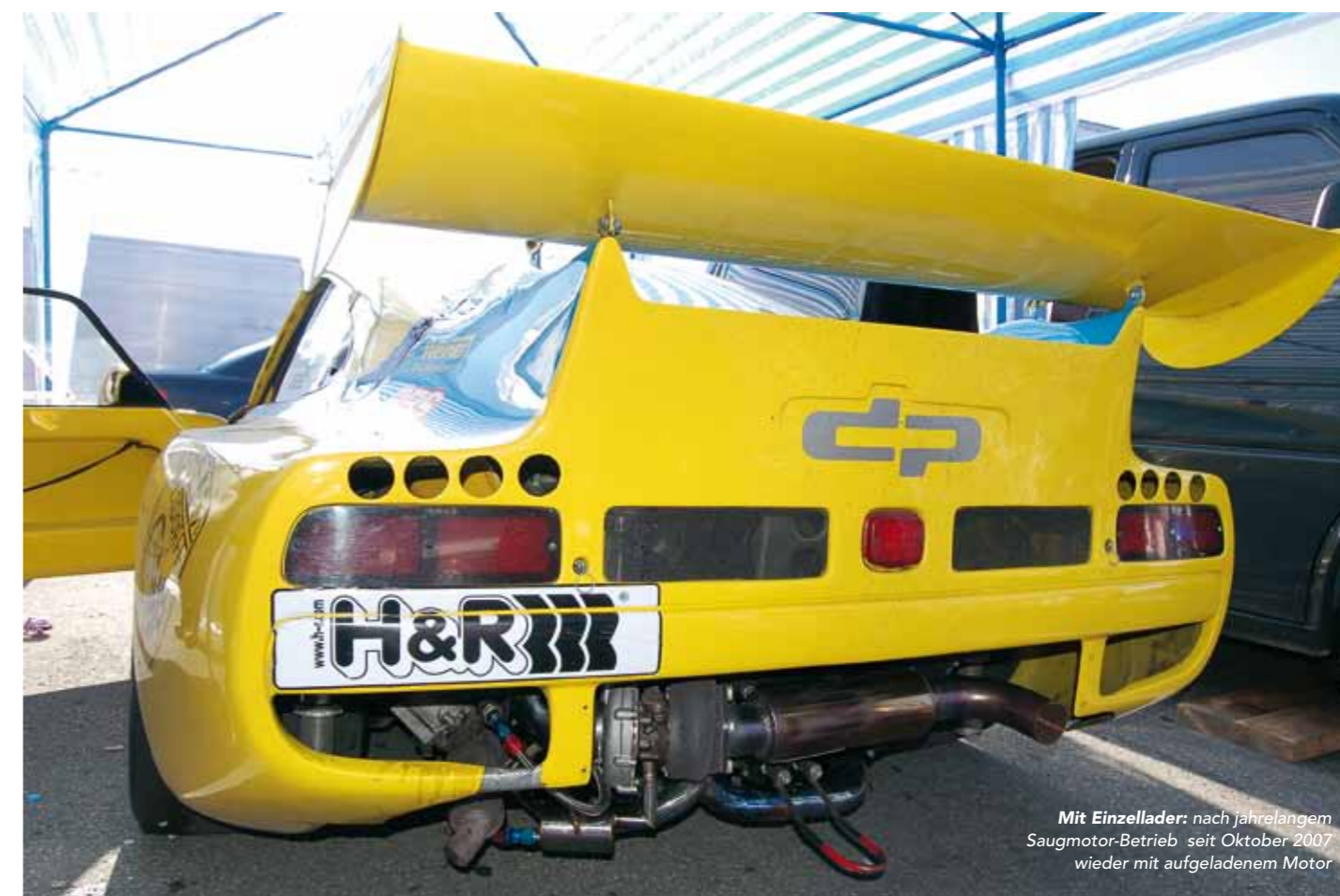
Mit Einzellader: nach jahrelangem Saugmotor-Betrieb seit Oktober 2007 wieder mit aufgeladenem Motor