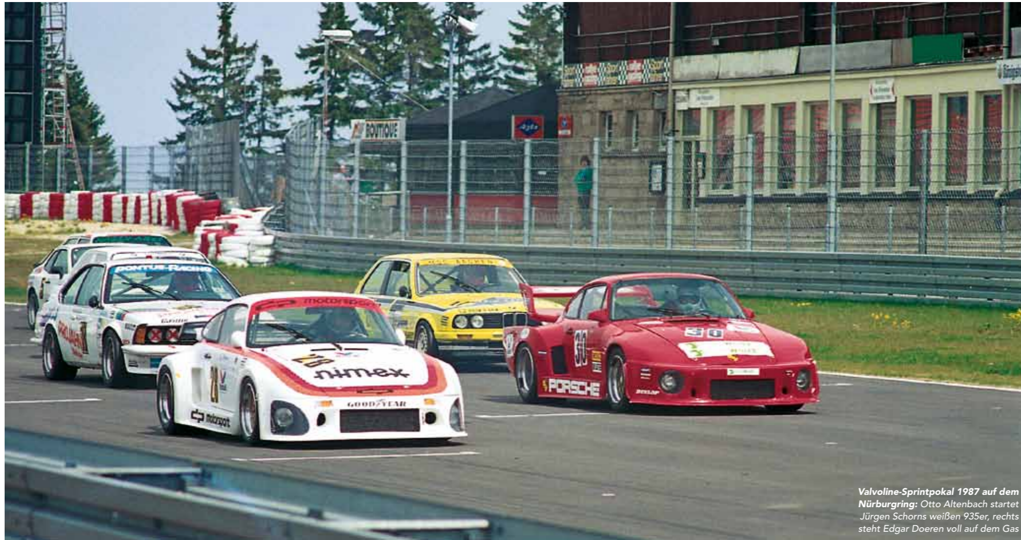
Valvoline-Sprintpokal 1987 auf dem Nürburgring: Otto Altenbach startet Jürgen Schorns weißen 935er, rechts steht Edgar Doeren voll auf dem Gas